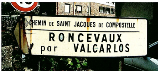
Señalización en Saint-Jean-Pied-de-Port

Existe un servicio de taxi desde Roncesvalles (948 76 00