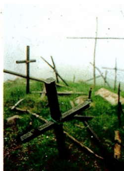
Cruces en Ibañeta

El Camino deja a la izquierda la fuente y baja en busca de una pista forestal que se adentra en el hayedo. Tras tomar una bifurcación a la derecha, se alcanza el collado Lepoeder y la carretera asfaltada del repetidor de comunicaciones. Desde ella se puede bajar a Roncesvalles por la pequeña carretera que a la derecha lleva al puerto de Ibañeta y la cruz de Roldán, completando un kilómetro más en el rodeo, o descender por el antiguo camino de la Colegiata. En el collado de Ibañeta Roldán, caballero franco al mando de la retaguardia del ejército carolingio, se enfrentó a los vascones en el año 778. Herido de muerte, hizo sonar su cuerno de